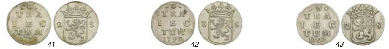
41 Dubbele wapenstuiver 1788 met kabelrand. CNM 2.43.140; HPM 87. Prachtig. 125 42 Dubbele wapenstuiver 1790 met kabelrand. CNM 2.43.140; HPM 87. Vrijwel prachtig. 100 43 Dubbele wapenstuiver 1792 met kabelrand. CNM 2.43.140; HPM 87. Zeer zeldzaam. Zeer fraai. 150