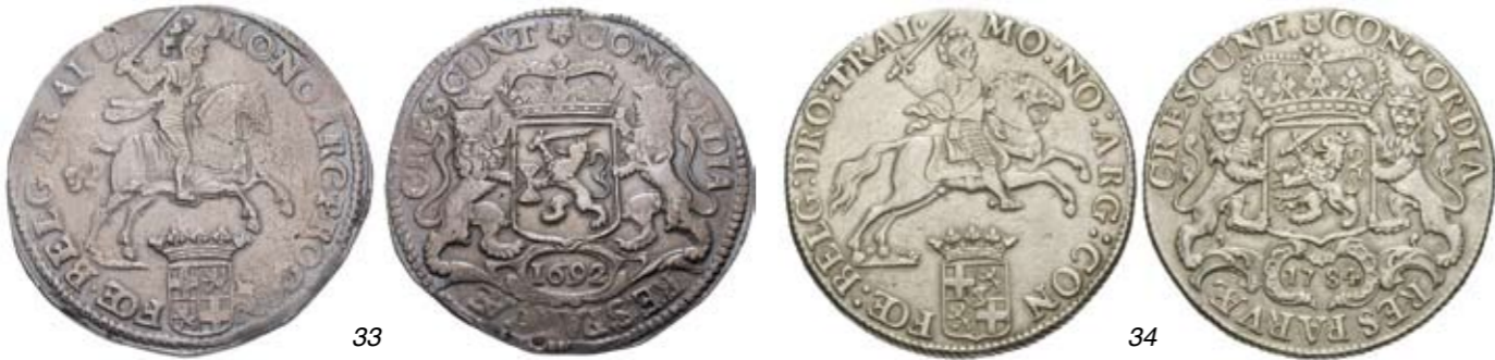
33 Zilveren rijder of dukaton 1692. Delm. 1031; CNM 2.43.98; HPM 58. Fraai / zeer fraai. 150 34 Zilveren rijder of dukaton 1784. Delm. 1031; CNM 2.43.101; HPM 59. Krasje onder hoofd paard. Ruim zeer fraai. 75 35 1/2 Zilveren rijder of 1/2 dukaton 1780 kabelrand. Delm. 1055; CNM 2.43.106; HPM 60. Gaatje door zwakte in muntplaatje, toch nog bijna zeer fraai. 40