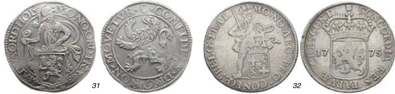
31 Leeuwendaalder 1589 op Hollandse voet. Mt. stadsschild. Delm. 841; CNM 2.43.56; HPM 34. Ruim zeer fraai. 175 32 Zilveren dukaat 1775. Delm. 982; CNM 2.43.92; HPM 65. Fraai / zeer fraai. 75