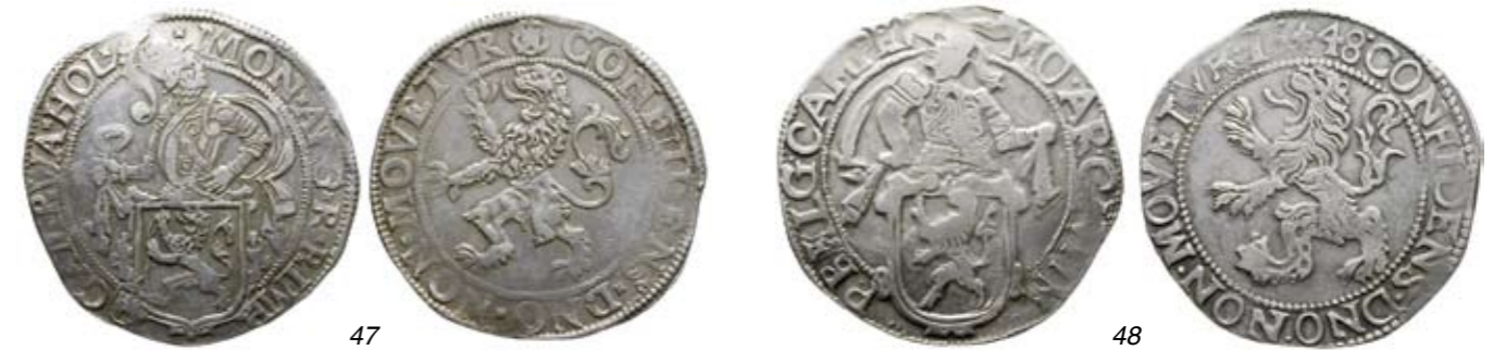
Kampen 47 Leeuwendaalder z.j. op Hollandse voet. Delm. 861; CNM 2.30.29; HPM 27. Fraai / zeer fraai. 80 48 Leeuwendaalder 1648. Delm. 862; CNM 2.30.37; HPM 29. Fraai / zeer fraai. 60