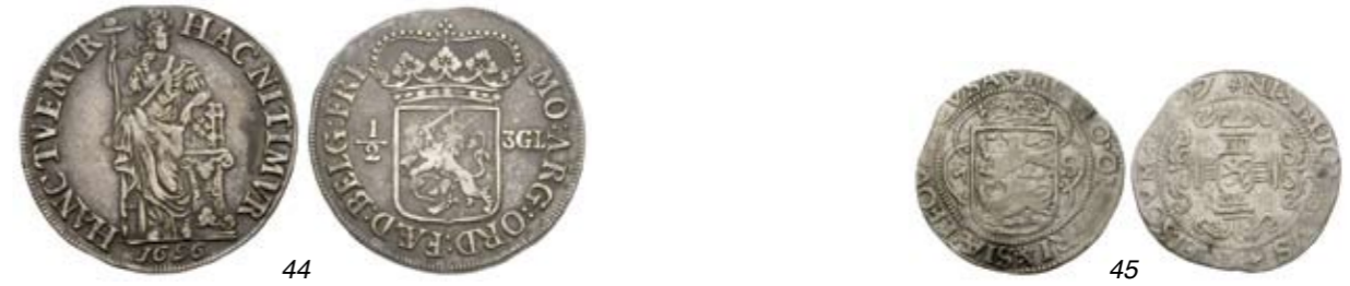
44 Halve 3 gulden 1696. Delm. 1160; CNM 2.16.98; HPM 49. Donker patina. Zeer fraai. 150 45 2 Stuiver 1597, omschrift vz.: MO.NO.ORD.FRI [leeuwtje] S/Æ.LEOVAR.CVSA Vgl. CNM 2.16.110; vgl. HPM 71. Fraai. 75