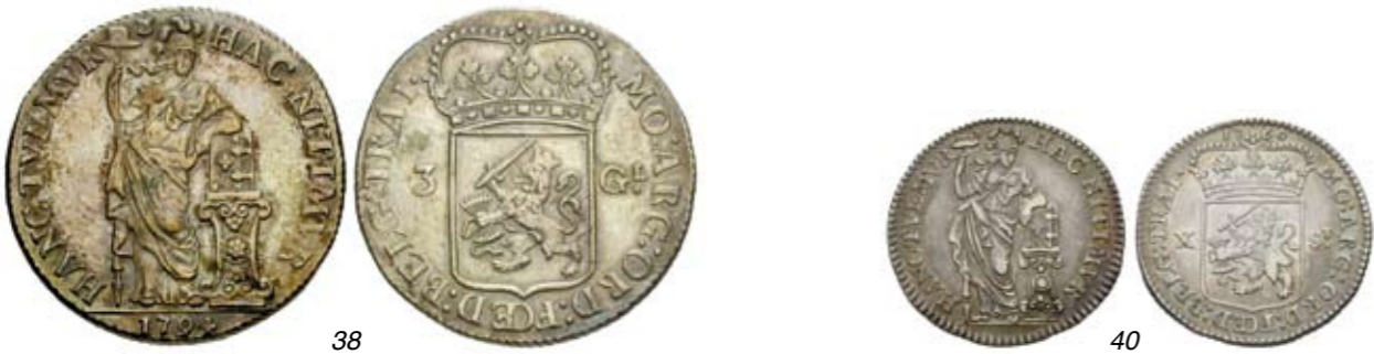
38 3 Gulden 1794. Delm. 1150; CNM 2.43.117; HPM 71. Zeer fraai. 90 39 1 Gulden 1715. Delm. 1182; CNM 2.43.119; HPM 72. Zeer fraai. 30 40 X Stuiver 1760. Delm. 1203; CNM 2.43.125; HPM 75. Patina. Prachtig. 75