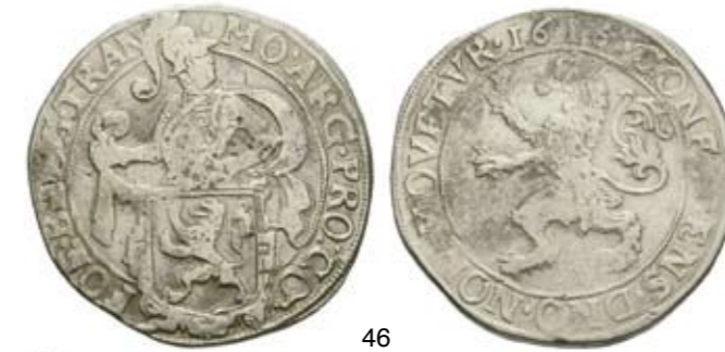
46 Leeuwendaalder 1616. Delm. 856; CNM 2.38.63; HPM 37. Zeer fraai. 80