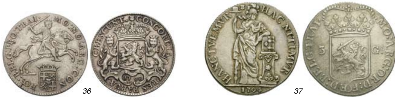
36 1/2 Zilveren rijder of 1/2 dukaton 1788. Delm. 1055; CNM 2.43.106; HPM 60. Gepoetst. Ruim zeer fraai. 75 37 3 Gulden 1794. Delm. 1150; CNM 2.43.117; HPM 71. Ruim zeer fraai. 100