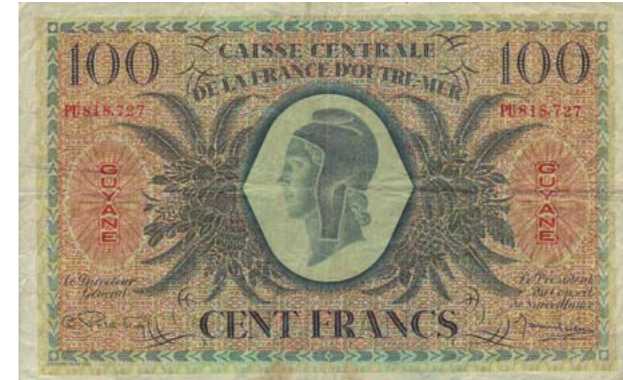
1192 / 75%