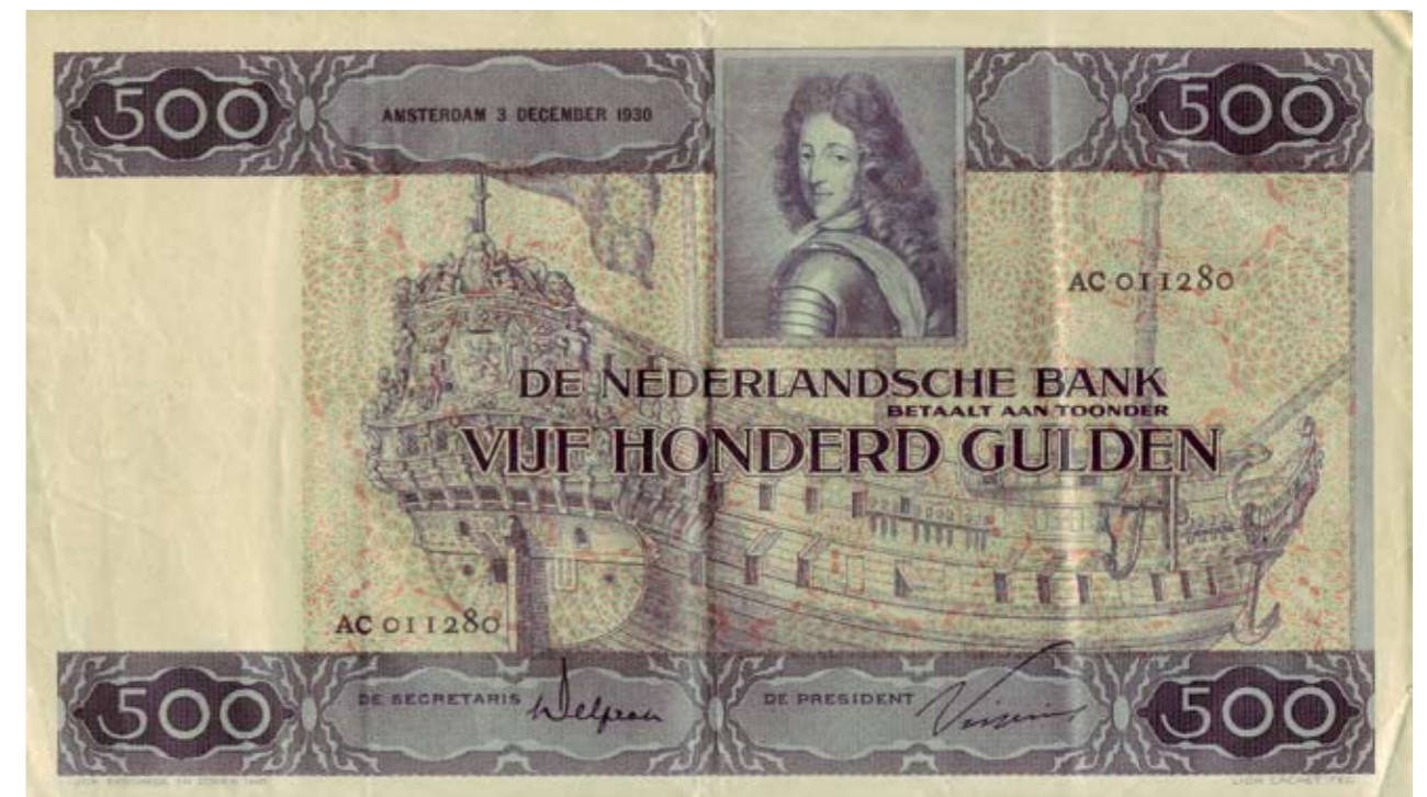
1176 / 75%