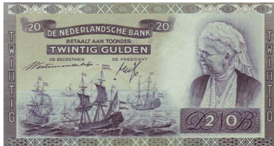
1149 / 75%