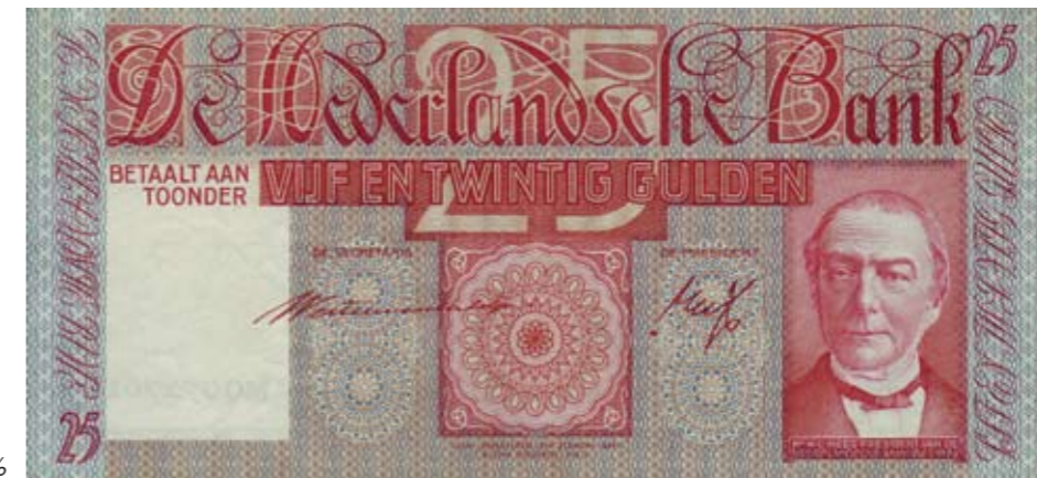
1153 / 75%