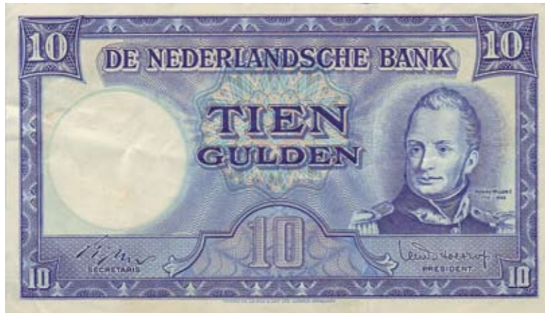
1141 / 75%