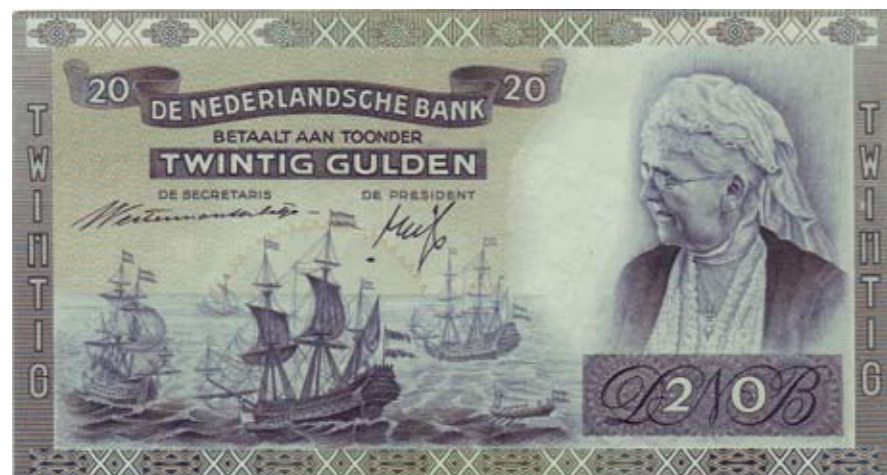
1150 / 75%