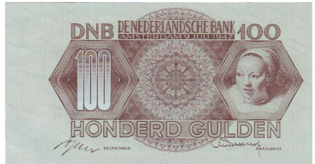
1173 / 75%