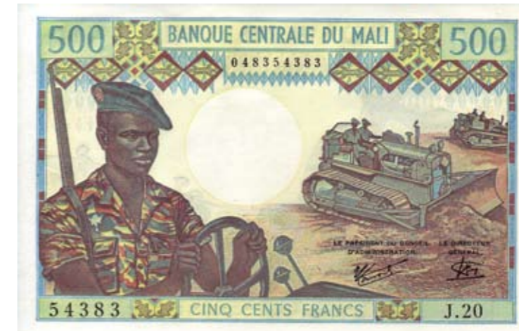
1193 / 75%