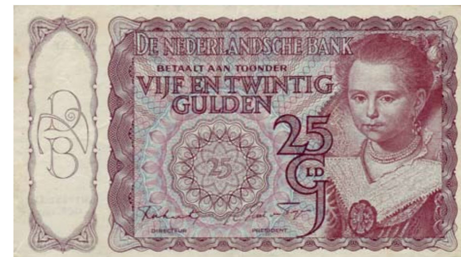
1156 / 75%