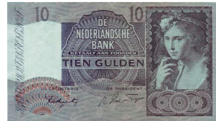
1132 5 Gulden 1944 (# 070206) Mev. 22-1a; AV 17.1. Achterzijde beschreven. Ruim zeer fraai. 50 1133 Lot (4) 5 Gulden 1966 Vondel I. Mev. 23-1a; AV 18.1a/1b. Ongecirculeerd. 30 1134 Lot (7) 5 Gulden 1966 Vondel I. Mev. 23-1a. Opeenvolgende serienummers. Ongecirculeerd. 75 1135 Lot (73) o.a. 5 gulden 1966 Vondel I (16), 5 gulden 1973 Vondel II (48), 10 gulden 1968 Frans Hals(7), 25 gulden 1971 Sweelinck (1), 50 gulden 1982 Zonnehloem (1). Overwegend UNC. 200 1136 Lot (7) 10 Gulden 1933, 1940, 1943I, 1943II en 3x 1953. Zeer fraai en beter. 100 1137 Lot (6) 10 Gulden 1933, 1940I, 4 febr. 1943 en 3x 1953. Zeer fraai en beter. 100