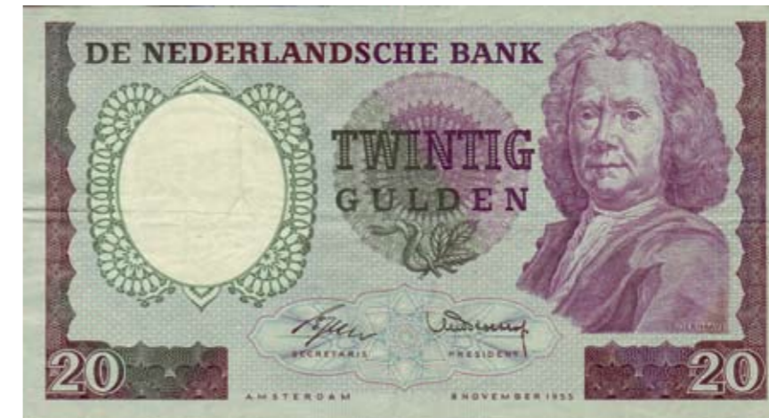
1151 / 75%