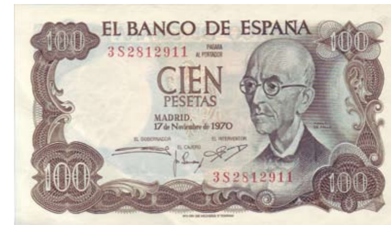
1196 / 75%