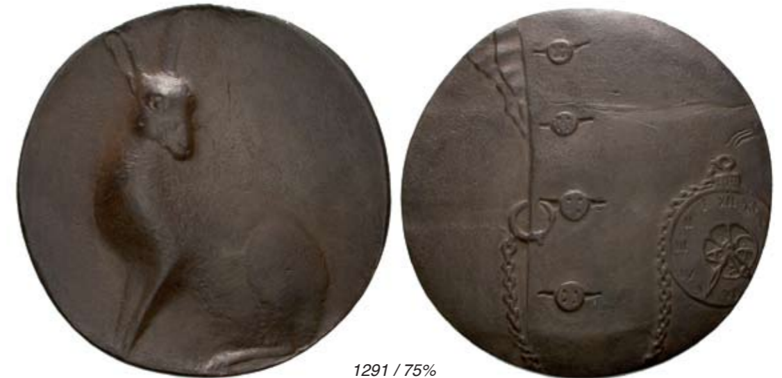
1291 / 75%