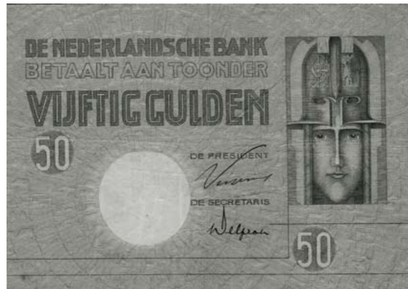
1169 / 75%