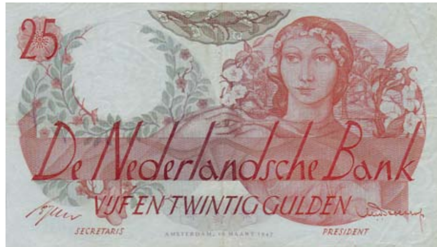
1159 / 75%