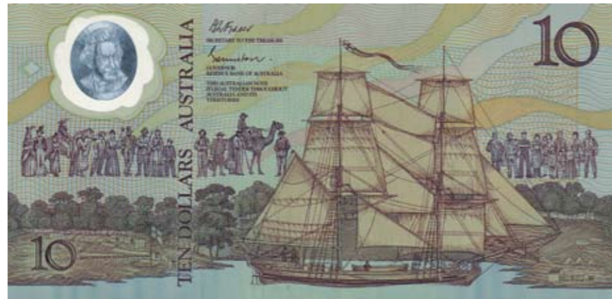
1189 / 75%