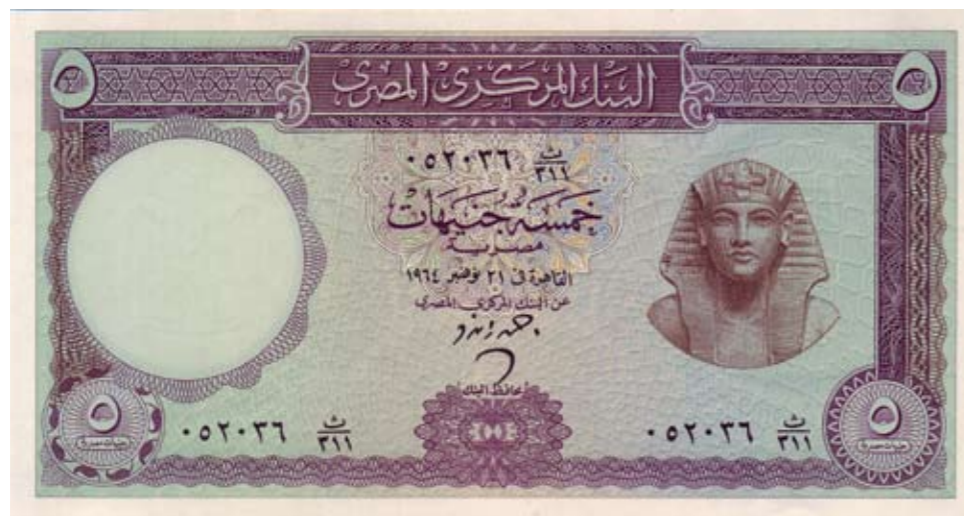
1191 / 75%