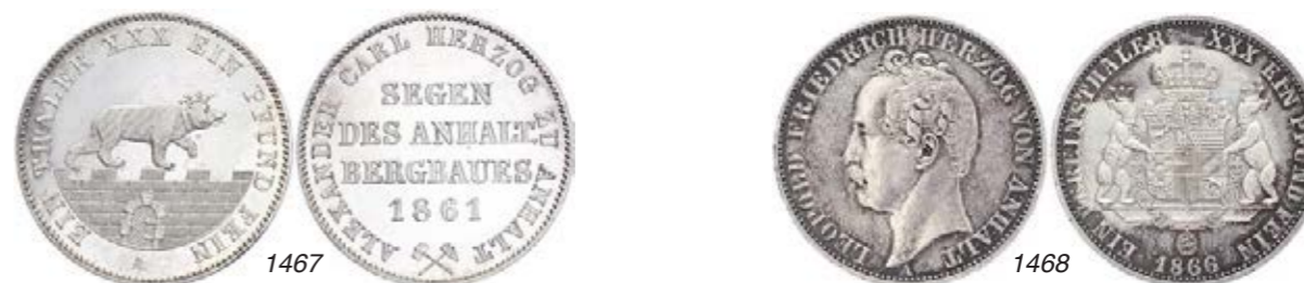
GERMANY / DEUTSCHLAND / DUITSLAND