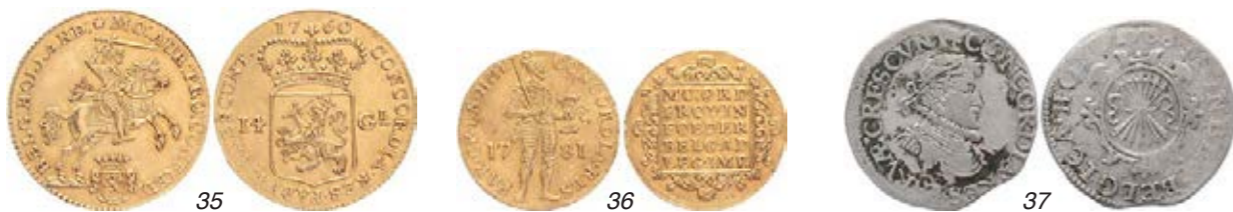
HOLLAND, Provincie 1575-1794