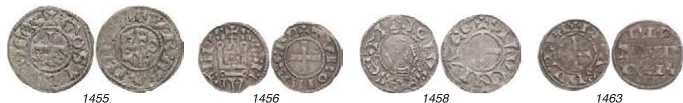
FRANCE – MONNAIES FÉODALES / FRANKRIJK