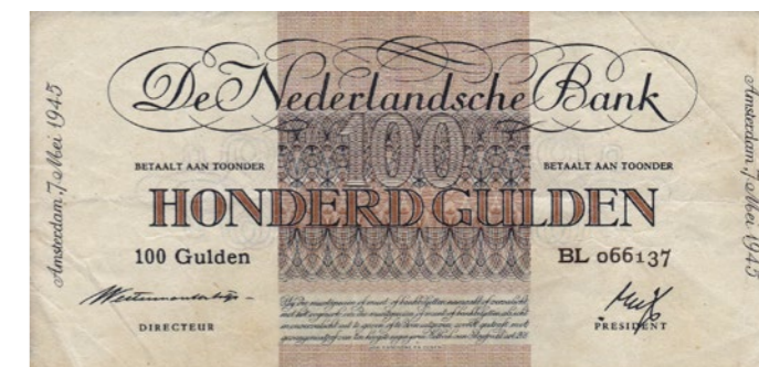
1867 60 %

1865 100 Gulden 1921 Grietje Seel. Mev. 116-1b; PL 96.b. [# AN 087643]. Vrijwel zeer fraai. 125