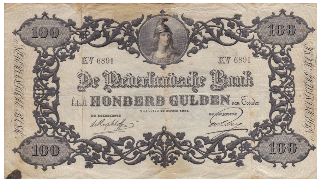
1864 75 %

1863 60 Gulden 1921 Frederik Hendrik. Mev. 108-2; PL 88.b. [# AR 043405]. Ruim fraai bijna zeer fraai. 1.000