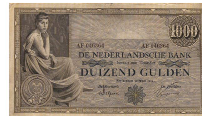
1870 40 %

1868 100 Gulden 1947 Adriaantje Hollaer. Mev. 120-1; PL 100. [# 2 AK 048372]. Almost Unc. 100