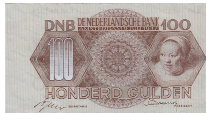
1868 60 %

1867 100 Gulden 1945 Geldzuivering. Mev. 119-1a; PL 99.b. [# BL 066137]. Ruim fraai bijna zeer fraai. 300