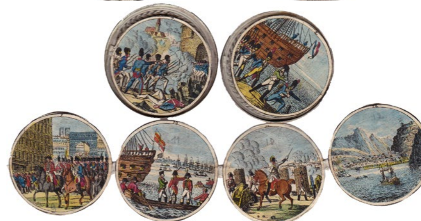
Afbeeldingen 75% verkleind