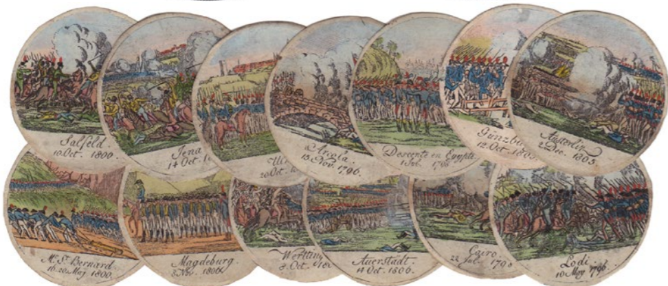
Afbeeldingen 75% verkleind