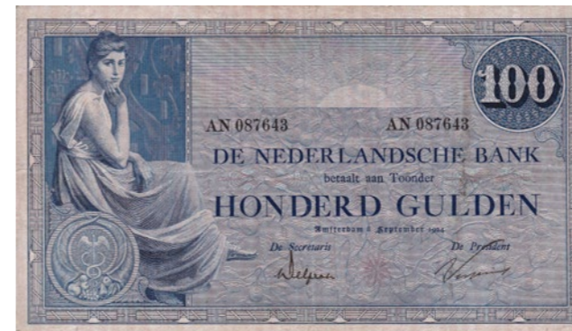
1865 40 %

1864 100 Gulden 1860 de Hoop Scheffer / v.d. Berg. Mev. 114-7. [#KV 6891]. Ondanks de matige kwaliteit, is dit uiterst zeldzame biljet aanbevelingswaardig! Ruim fraai. 2.500