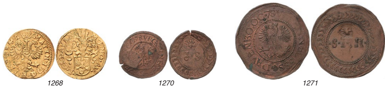
Beleg Graaf van Rennenberg 3 aug. – 18 nov. 1578