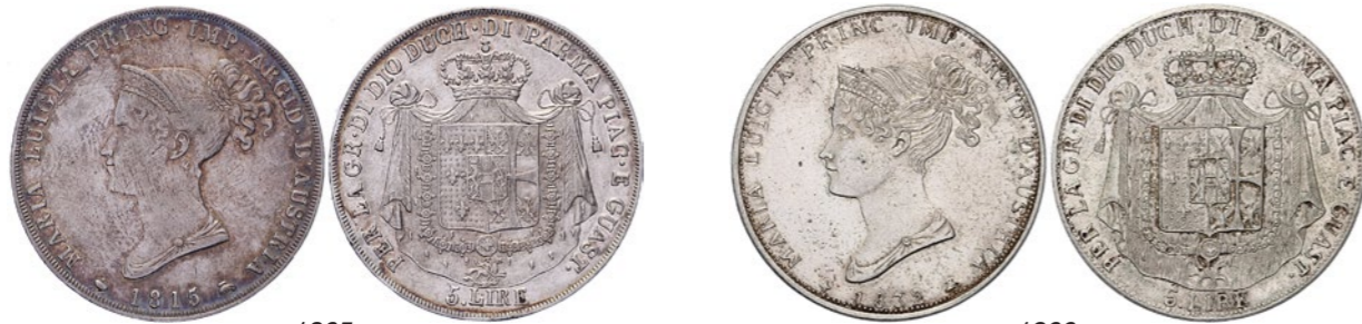
PARMA Maria Luigia 1815-1847