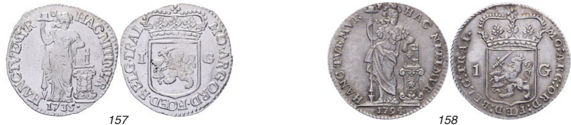
157 1 Gulden 1735. Delm. 1182; CNM 2.43.120; HPM 72. Minerva zwak, anders prachtig. 50 158 1 Gulden 1794. Delm. 1182; CNM 2.43.121; HPM 73. Minimale justeerstreepjes keerzijde. Prachtig. 40