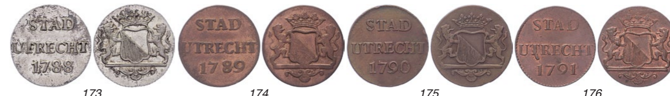
173 Duit 1788. Afslag in zilver van 2,84 gram. PW 5114.3; CNM 2.44.22; HPM 20.3. Prachtig. 75 174 Duit 1789, afsnede met dikke lijn. PW 5114 var.; CNM 2.44.22; HPM 20. Orig. kleur, maar wel zwakke slag. Ca. Prachtig. 25 175 Duit 1790, afsnede met dubbele lijn (?). PW 5114 var.; CNM 2.44.22; HPM 20. Prachtig. 25 176 Duit 1791. PW 5114; CNM 2.44.22; HPM 20. Originele kleur. Prachtig / FDC. 25