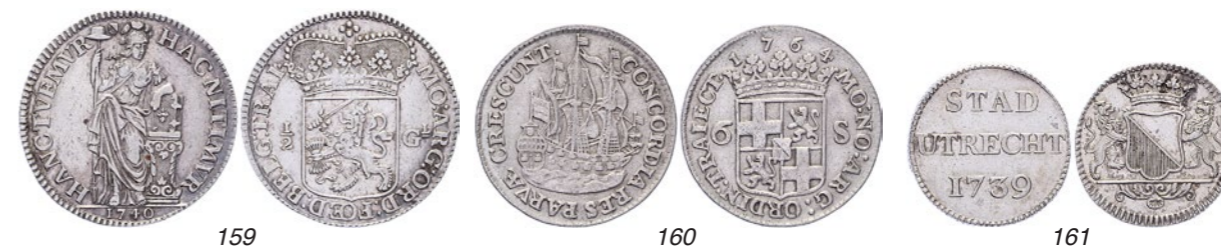
159 ½ Gulden 1740. Delm. 1202; CNM 2.43.123; HPM 74. Zeer fraai / Prachtig. 125 160 Scheepjesschelling 1764, gladde rand. CNM 2.43.127; HPM 84. Ruim zeer fraai. 50