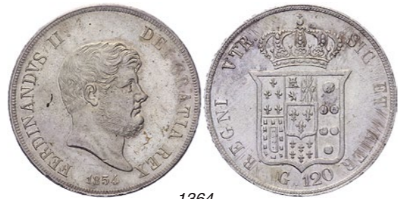
NAPLES Ferdinando II 1830-1859

1364 120 Grana 1854. Dav. 175; KM 370. Adjustment marks reverse, otherwise EF.