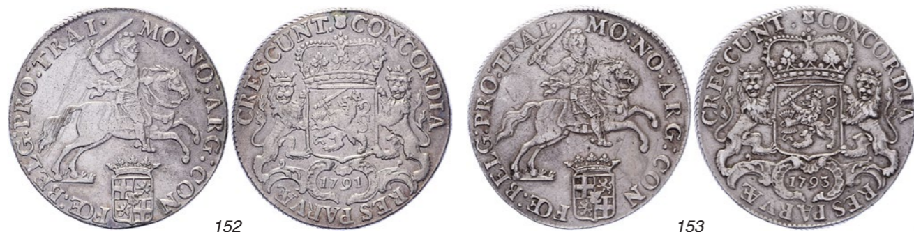
152 Rijder of dukaton 1791. Delm. 1031; CNM 2.43.101; HPM 59. Krassen voorzijde. Zeer fraai. 75 153 Rijder of dukaton 1793. Delm. 1031; CNM 2.43.101; HPM 59. Zeer fraai. 100