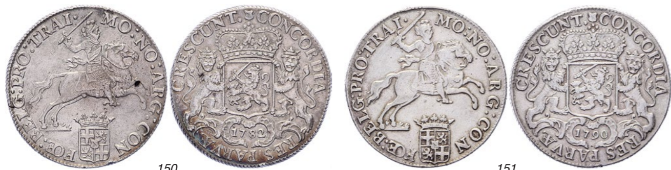
150 Rijder of dukaton 1782. Delm. 1031; CNM 2.43.101; HPM 59. Gietgal linker voorbeen paard. Prachtig. 125 151 Rijder of dukaton 1790. Delm. 1031; CNM 2.43.101; HPM 59. Zeer fraai. 75