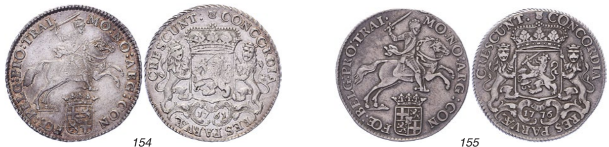
154 ½ Rijder of ½ dukaton 1761. Delm. 1055; CNM 2.43.106; HPM 60. Iets zwak geslagen, originele kleur. Ruim prachtig. 200 155 ½ Rijder of ½ dukaton 1776, kabelrand. Delm. 1055; CNM 2.43.106; HPM 60. Zeer fraai / Prachtig. 150