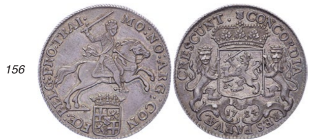
156 ½ Rijder of ½ dukaton 1784. Delm. 1055; CNM 2.43.106; HPM 60. Mooi donker patina. Vrijwel FDC. 250