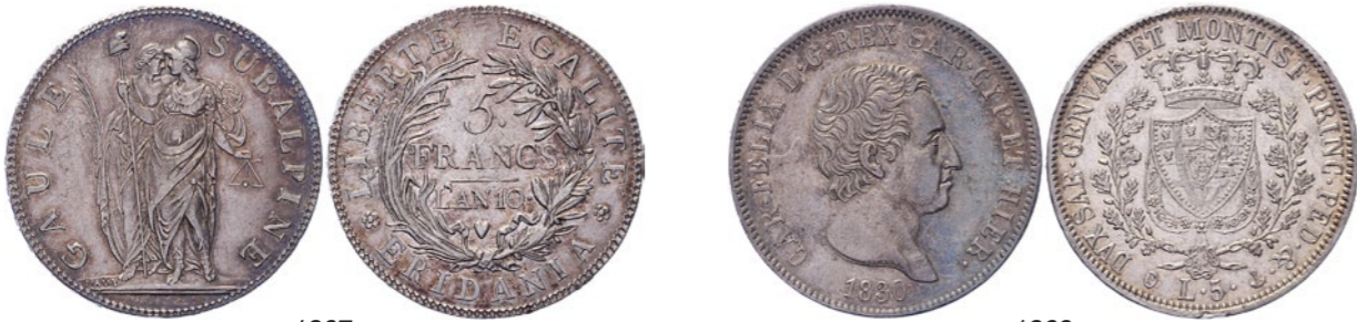
SARDINIA Carlo Felice 1821-1831

1368 5 Lire 1830 P/anchor. Dav. 135; KM 116.2; Cud. 1035p. EF.