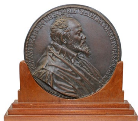
1157 verkleind afgebeeld