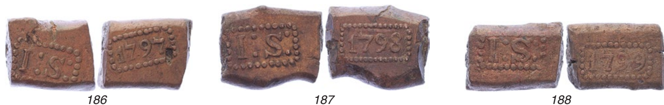
186 Java. 1 Stuiverbank 1797 [24,19 gram]. Scholten 479. Pit op jaartzijde. Zeer fraai. 60 187 Java. 1 Stuiverbank 1798 [22,90 gram]. Scholten 480. Ruim zeer fraai. 125 188 Java. 1 Stuiverbank 1799 [20,90 gram]. Scholten 481. Zeldzaam. Fraai. 75