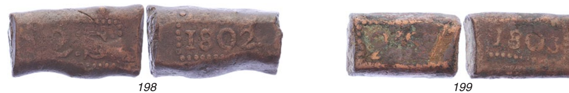
198 Java. 2 Stuiverbank 1802 [45,09 gram]. Scholten 539. Fraai. 50 199 Java. 2 Stuiverbank 1803 [35,65 gram]. Scholten 540. Minder dan fraai. 20