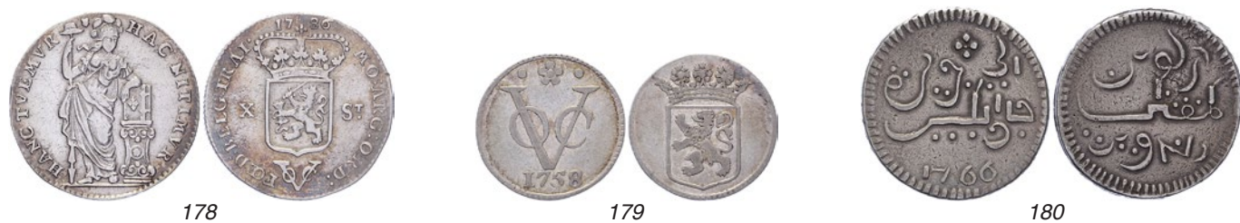
178 Utrecht. X Stuiver 1786. Scholten 73c. Zeer fraai. 50 179 Holland. Duit 1758. Afslag in zilver van 2,78 gram. Scholten 137. Zeer fraai. 50 180 Java. Ropij 1766. Scholten 458. Schaars. Zeer fraai. 75