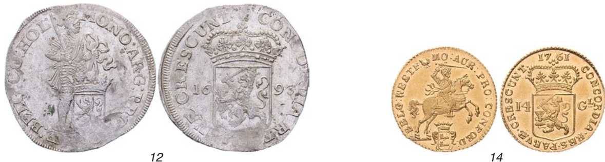
WEST-FRIESLAND, Gewest 1584-1795