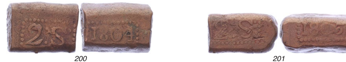
200 Java. 2 Stuiverbank 1804 [44,13 gram]. Scholten 541. Bijna zeer fraai. 75 201 Java. 2 Stuiverbank 1805 [38,60 gram]. Scholten 542. Fraai. 50