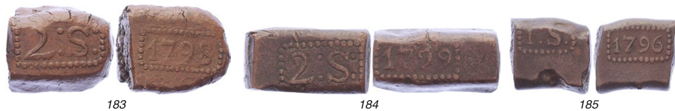
183 Java. 2 Stuiverbank 1798 [42,63 gram] in de vorm van een duim. Scholten 476. Bijna zeer fraai. 100 184 Java. 2 Stuiverbank 1799 [42,72 gram]. Scholten 477. Schaars jaartal. Bijna zeer fraai. 100 185 Java. 1 Stuiverbank 1796 [19,11 gram]. Scholten 478. Fraai. 50