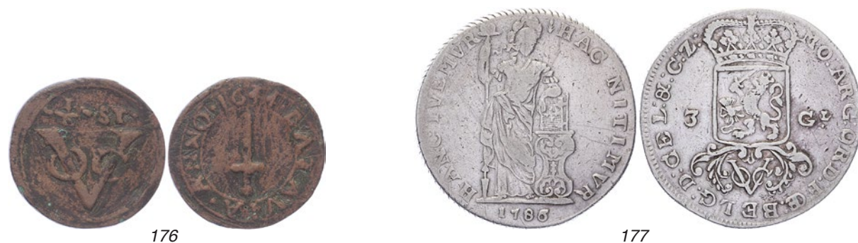
176 Batavia. ½ Stuiver 1644. Scholten 18. Fraai / Zeer fraai. 50 177 West-Friesland. 3 Gulden 1786. Scholten 62a. Krassen voorzijde. Fraai. 150