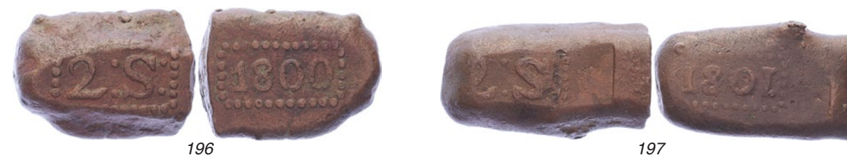
196 Java. 2 Stuiverbank 1800 [45,93 gram] met Arabische 1. Scholten 537. Zeer fraai. 100 197 Java. 2 Stuiverbank 1801 [49,48 gram] type'duim' met Romeinse I. Scholten 538. Fraai / Zeer fraai. 75