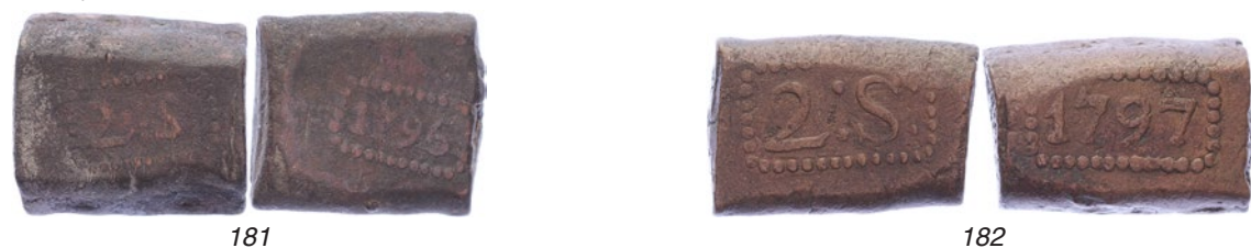
181 Java. 2 Stuiverbank 1796 [45,85 gram]. Scholten 474b/c-variant. Fraai. 50 182 Java. 2 Stuiverbank 1797 [45,93 gram]. Scholten 475. Zeer fraai. 100