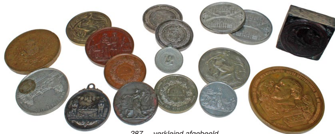
287 verkleind afgebeeld