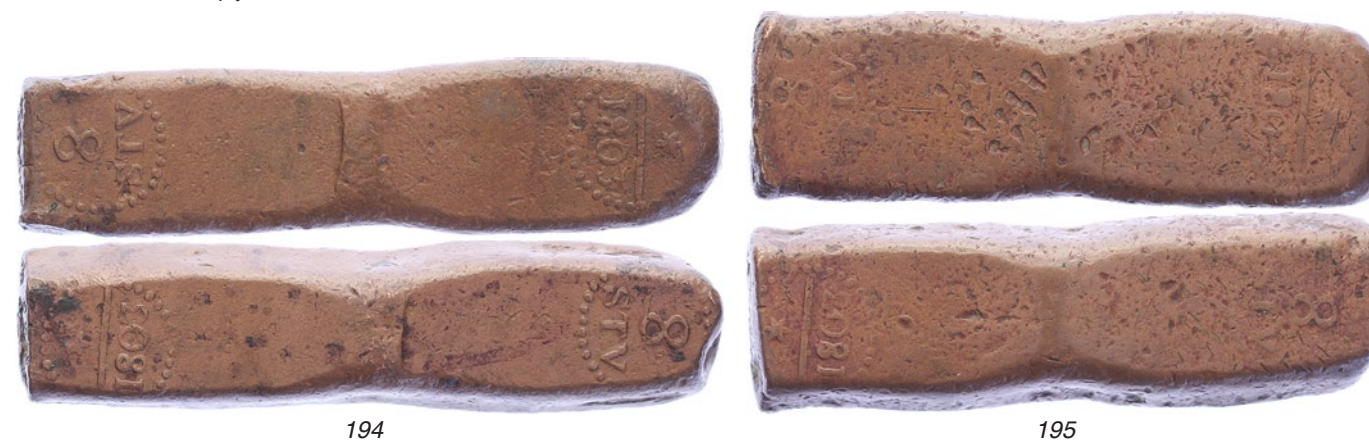
194 Java. 8 Stuiverbank 1803 [152,35 gram, lengte: 91 mm.]. Scholten 536. Zeldzaam. Bijna zeer fraai. 300 195 Java. 8 Stuiverbank 1803 [151,10 gram, lengte: 82 mm.]. Scholten 536. Zeldzaam. Fraai. 150