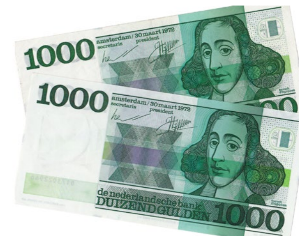
729 verkleind afgebeeld

729 Lot (2) 1.000 Gulden 1972 Spinoza. Mev. 155-1; PL 128 en PL 128a [# 0173022966 en # 0092842326]. Type I en II. Gelijk en ongelijkbenig plaatdrukcaliber. Vrijwel UNC.