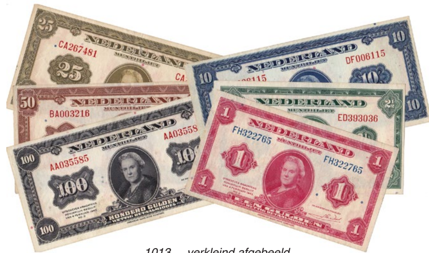
1013 verkleind afgebeeld

1012 1000 Gulden 1926 Grietje Seel. Mev. 152-1; AV 106A.1; PL 124.a [# AK 095483]. Ruim fraai. 75