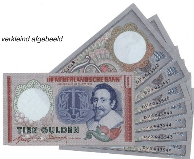
1002 verkleind afgebeeld