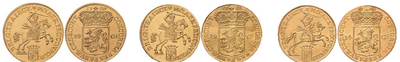
211 Rijder 1750. Delm. 970; CNM 2.43.37; HPM 31 [9,95 gram]. Prachtig. 500 212 Rijder 1751. Delm. 970; CNM 2.43.37; HPM 31 [9,89 gram]. Ruim prachtig. 500 213 Rijder 1760. Delm. 970; CNM 2.43.37; HPM 31 [9,90 gram]. Klemsporen! Prachtig. 500