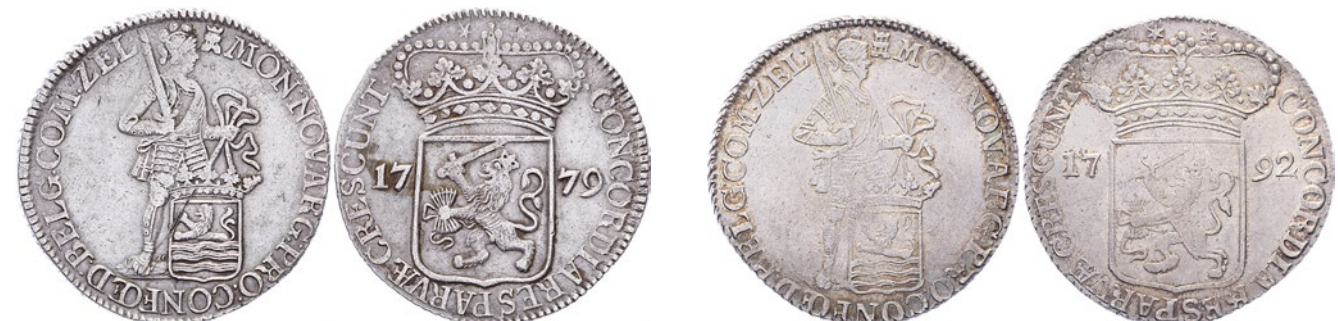
201 Dukaat 1779. Delm. 976; CNM 2.49.50; HPM 50. Flinke kras op voorzijde. Zeer fraai. 50 202 Dukaat 1780. Delm. 976; CNM 2.49.50; HPM 50. Fraai. 40 203 Dukaat 1792. Delm. 976; CNM 2.49.50; HPM 50. Prachtig. 150