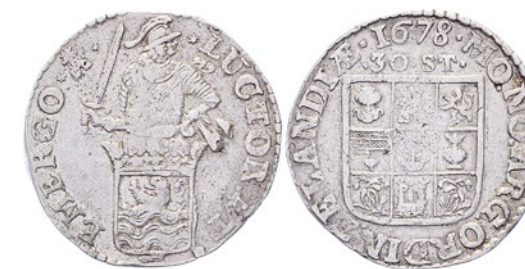
204 Daalder van 30 Stuiver 1678. Delm. 1082; CNM 2.49.65; HPM 61. Vrijwel zeer fraai. 100