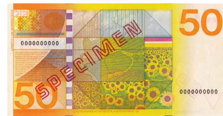
1008 verkleind afgebeeld