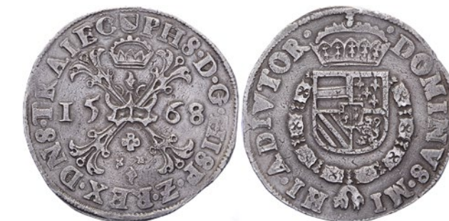
210 Bourgondische kruisdaalder 1568. Delm. 95; CNM 2.43.18. Vrijwel zeer fraai. 125