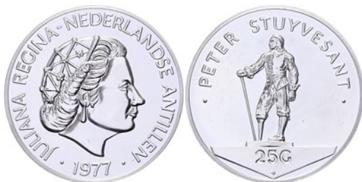
395 (verkleind afgebeeld)