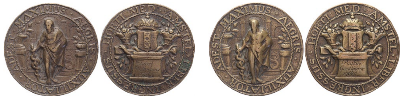
1483 80% 1484

1483 1758. Collegium Medicum. Toegangspenning Hortus Medicus. O.n.v. Jacob Wellenkamp. Messing 50,6. WK 30.3. Zeer fraai.