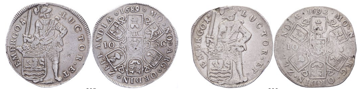
205 Dubbele daalder van 10 Schelling 1689 uit 1688. Delm. 1074; CNM 2.49.67; HPM 59. Ruim zeer fraai. 150 206 Dubbele daalder van 10 Schelling 1692. Delm. 1074; CNM 2.49.67; HPM 59. Zeer fraai. 50 207 Lot (4) 1/8 dukaat 1763 (2), dubbele stuiver 1730/29 en bezemstuiver 1791. CNM 2.49.55; 2.49.95 en 2.49.100. Fraai tot prachtig. 75 208 Duit 1780. Incusum, kz. in spiegelschrift op vz. Zeer fraai. 25 209 Lot (3) Scheepjesschelling of 6 Stuiver 1753, Statenoord z.j. en Oord (1663) Maurits. 40