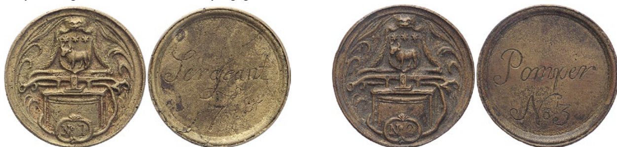
1488 80% 1489