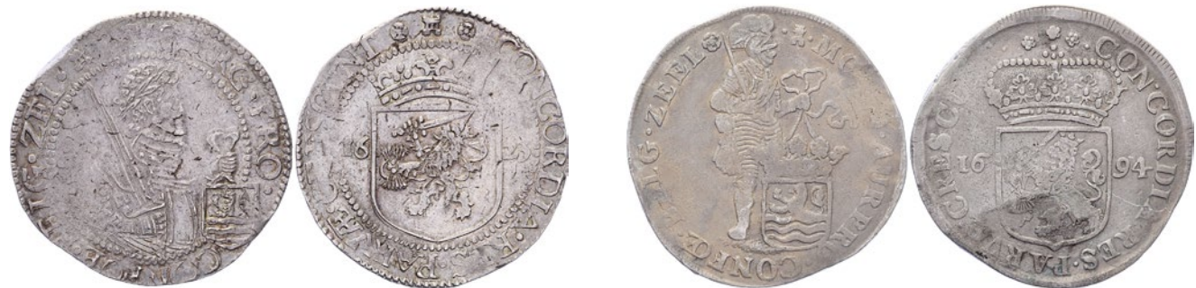
193 Nederlandse rijksdaalder 1623. Delm. 941; CNM 2.49.47; HPM 41. Schaars. Fraai. 50 194 Dukaat 1694 met Arabische 1 en ZEEL. Delm. 976; CNM 2.49.50; HPM 50. Fraai. 75