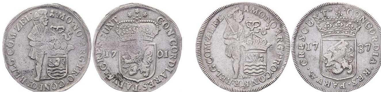
195 Dukaat 1701 uit 1698. Delm. 976; CNM 2.49.50; HPM 50. Ruim fraai / Bijna zeer fraai. 75 196 Dukaat 1737. Delm. 976; CNM 2.49.50; HPM 50. Ruim zeer fraai. 100 197 Dukaat 1737. Delm. 976; CNM 2.49.50; HPM 50. Fraai / Zeer fraai. 50