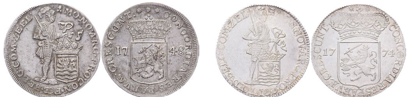
198 Dukaat 1748. Delm. 976; CNM 2.49.50; HPM 50. Ruim zeer fraai / Bijna prachtig. 125 199 Dukaat 1774. Delm. 976; CNM 2.49.50; HPM 50. Prachtig. 150 200 Dukaat 1778. Delm. 976; CNM 2.49.50; HPM 50. Zwak geslagen. Zeer fraai. 50