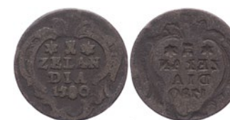
208 Duit 1780. Incusum, kz. in spiegelschrift op vz. Zeer fraai. 25