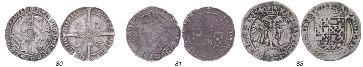
79 4 Brabantse Mijt z.j. Vanhoudt 19. Fraai+. 50