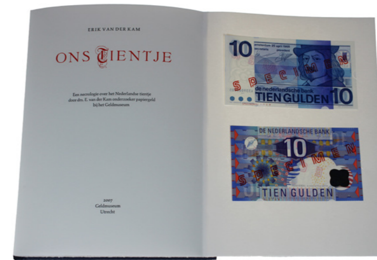
801 Verkleind afgebeeld