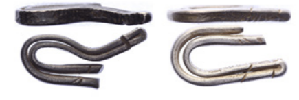
1549 Verkleind afgebeeld