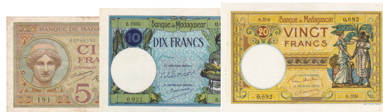
Afgebeelde bankbiljetten maken deel uit van lot 862