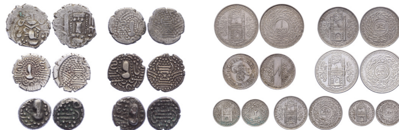
Deze munten maken deel uit van lot 1999