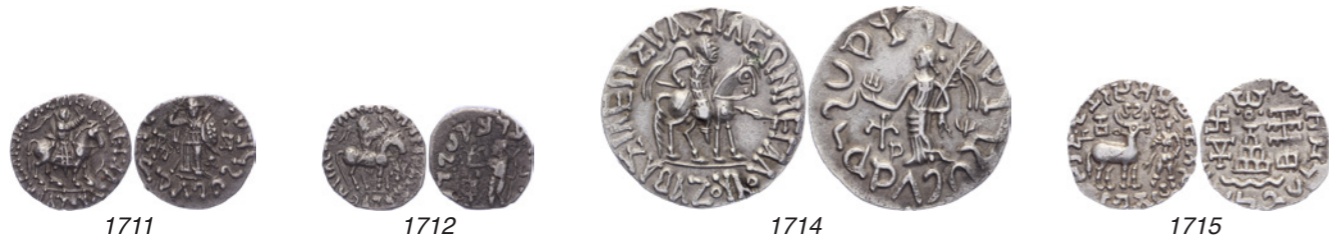
Azilises, ca. 57-35 BC