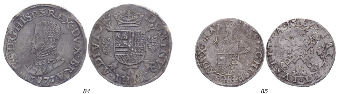
83 4 Stuiver 1540. Vanhoudt 262An. Fraai+. 50