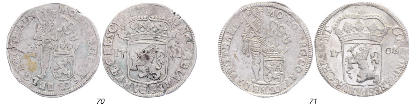
70 Zilveren dukaat 1701. Delm. 987; CNM 2.38.73; HPM 51. Slagbarstje. Bijna zeer fraai. 70 71 Zilveren dukaat 1708. Delm. 987; CNM 2.38.73; HPM 51. Prachtig. 125