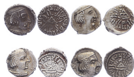
1996 Niet op ware grootte afgebeeld