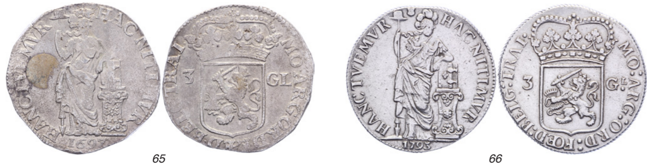
65 3 Gulden 1697. Delm. 1150; CNM 2.43.115; HPM 71. Vrijwel zeer fraai. 100 66 3 Gulden 1793. Delm. 1150; CNM 2.43.117. Zeer fraai. 100