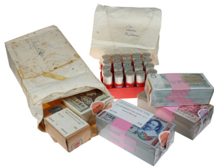
800 Verkleind afgebeeld