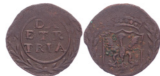
74 Duit z.j. Reckheimse imitatie DA-ETR-TRIA. PW 71.1. Wapenzijde aangetast. Zeer fraai. 25