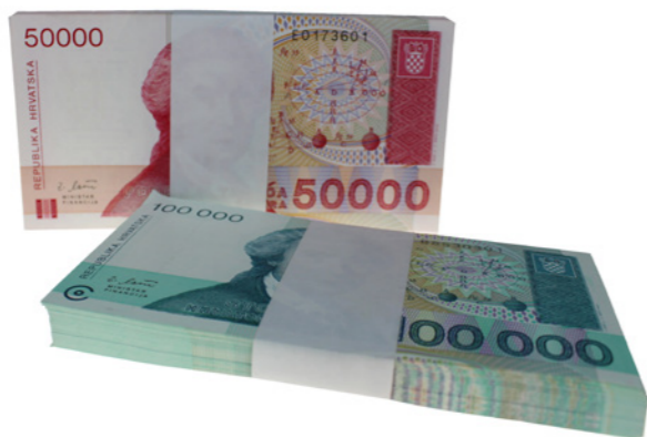
841 Verkleind afgebeeld