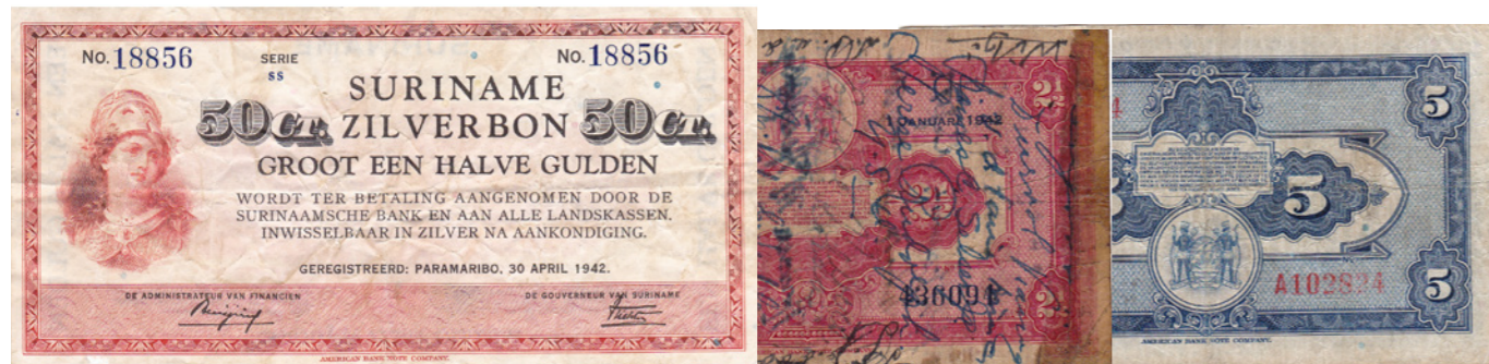
Afgebeelde bankbiljetten maken deel uit van lot 868

868 Lot (3) 50 Cent 1940 [# SS 18856]; 2 ½ Gulden 1940 [# 436094]; 5 Gulden 1942 [# A 102824]. PLS 12.1b; PLS 13.1b. Fraai en beter. 200