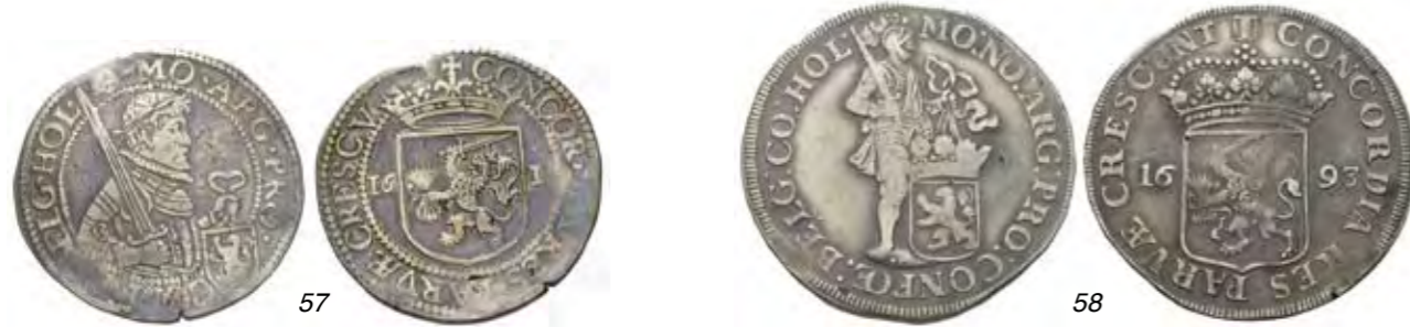
57 1/2 Nederlandse rijksdaalder 161(0). Delm. 995; CNM 2.28.78; HPM 41. Ruim fraai. 150 58 Zilveren dukaat 1693. Delm. 969; CNM 2.28.80; HPM 49. Klein gietgalletje. Ruim fraai / bijna zeer fraai. 75