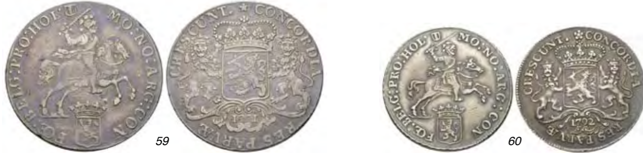
59 Zilveren rijder of dukaton 1771. Delm. 1014; CNM 2.28.84; HPM 45. Mooi patina. Prachtig. 150 60 1/2 Zilveren rijder of dukaton 1792. Delm. 1047; CNM 2.28.88; HPM 46. Ruim zeer fraai. 125