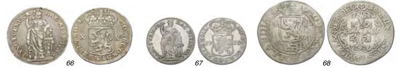
66 1/2 Gulden van X stuiver 1751 gladde rand. Delm. 1198; CNM 2.28.107; HPM 66. Zeer fraai. 30 67 1/4 Gulden of muntmeesterspenning 1759. V. 54.3; CNM 2.28.108; HPM 67. Ruim zeer fraai. 25 68 Roosschelling van 6 stuiver 1601. V. 55.01; CNM 2.28.111; HPM 70. Zeer fraai. 75 69 Lot (3) 1/50 Leicesterreaal z.j., dubbele wapenstuiver 1730 en bezemstuiver 1739. Fraai en beter. 15 70 Lot (2) Koperen duit z.j. (1590-1598) en duit 1780. PW 2004 en 2007; CNM 2.28.123 en 2.28.126; HPM 81 en 84. Zeer fraai. 35