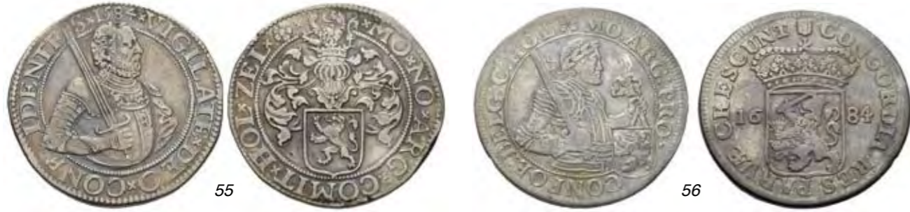
55 Gehelmde rijksdaalder of Prinsendaalder 1584. Delm. 921; CNM 2.28.70; HPM 36. Zeer fraai. 300 56 Nederlandse rijksdaalder 1684. Delm. 939; CNM 2.28.77; HPM 40. Zeer fraai. 150