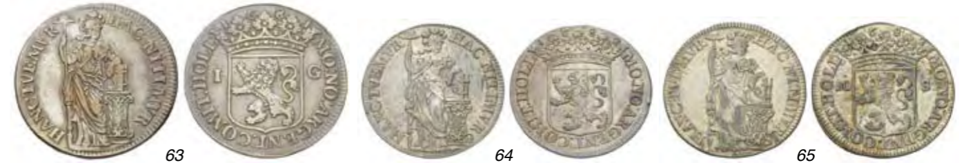
63 Provinciale gulden 1681. Delm. 1172; CNM 2.28.98; HPM 58. Zeer fraai / prachtig. 125 64 1/2 Provinciale gulden 1682 zonder waarde aanduiding! Delm. 1196; CNM 2.28.99; HPM 59.1. Zeer fraai. 125 65 1/2 Provinciale gulden van 10 stuiver 1682. Delm. 1196; CNM 2.28.99; HPM 59. Zeer fraai. 125