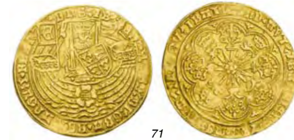
Gorinchem 71 Rozenobel van 9 gulden z.j. (1584-1591), met wapentje van de heerlijkheid Arkel op achtersteven. Delm. 826 bis; Fr. 80; CNM 2.18.3. [7,54 gram]. Zeer zeldzaam, mogelijk geklemd geweest. Zeer fraai. 1.500