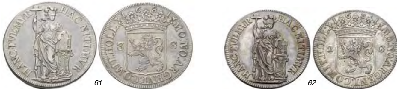
61 Provinciale 3 gulden 1681. Delm. 1126; CNM 2.28.96; HPM 56. Prachtig. 400 62 Provinciale 2 gulden 1681. Delm. 1142; CNM 2.28.97; HPM 57. Ruim zeer fraai, vrijwel prachtig. 250