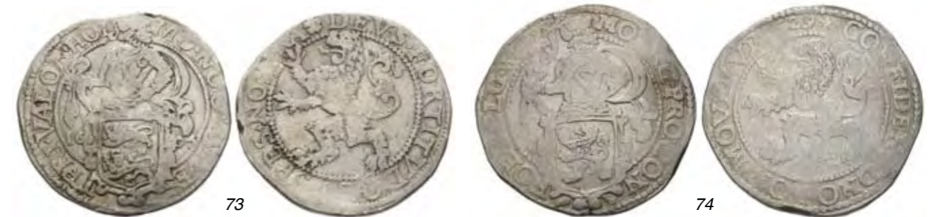
73 Leeuwendaalder 1605. Omschrift vz.: MO.NO.ORD.WES – TFRI.VALOR.HOL. Delm. 835; CNM 2.46.22; HPM 14. Fraai. 40 74 Leeuwendaalder 1629. Delm. 836; CNM 2.46.24; HPM 17. Ruim fraai. 50